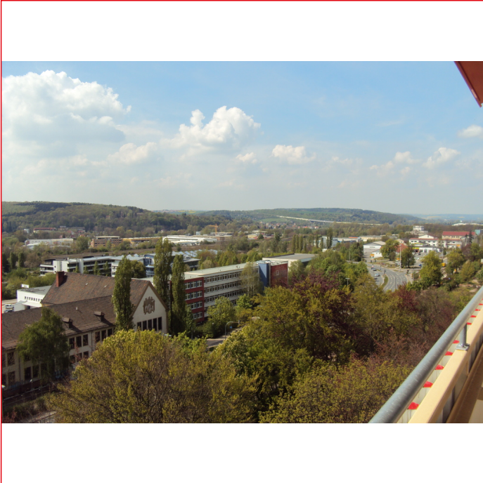
Ausblick vom Balkon