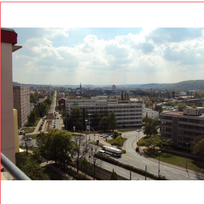
Ausblick vom Balkon